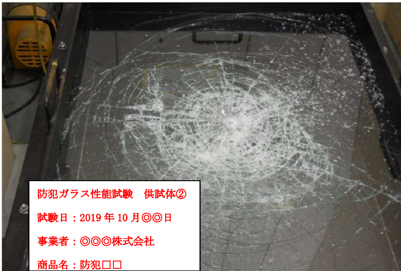
写真－2 供試体②試験結果状況