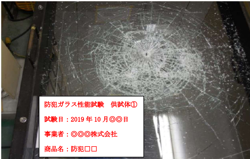
写真－1 供試体①試験結果状況